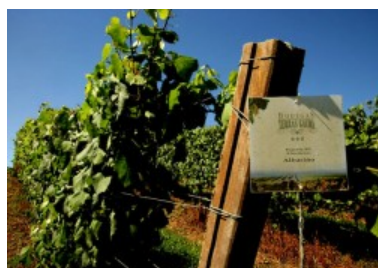
Viñedo Tierras Gauda