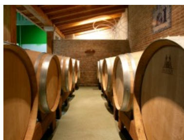
Barricas Terras Gauda Etiqueta Negra